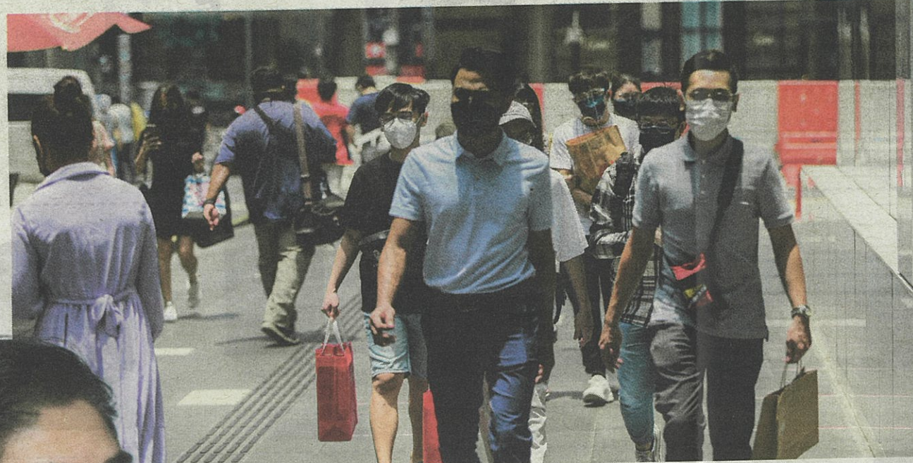
PERKESO menggalakkan OBS dalam lapan kumpulan sasaran memohon dan memanfaatkan inisiatif kerajaan iaitu Skim Pekerjaan Sendiri (SPS) Padanan Caruman di bawah Bajet 2022.

“Sehingga 27 September lalu, 322,371 OBS aktif bagi dua sektor