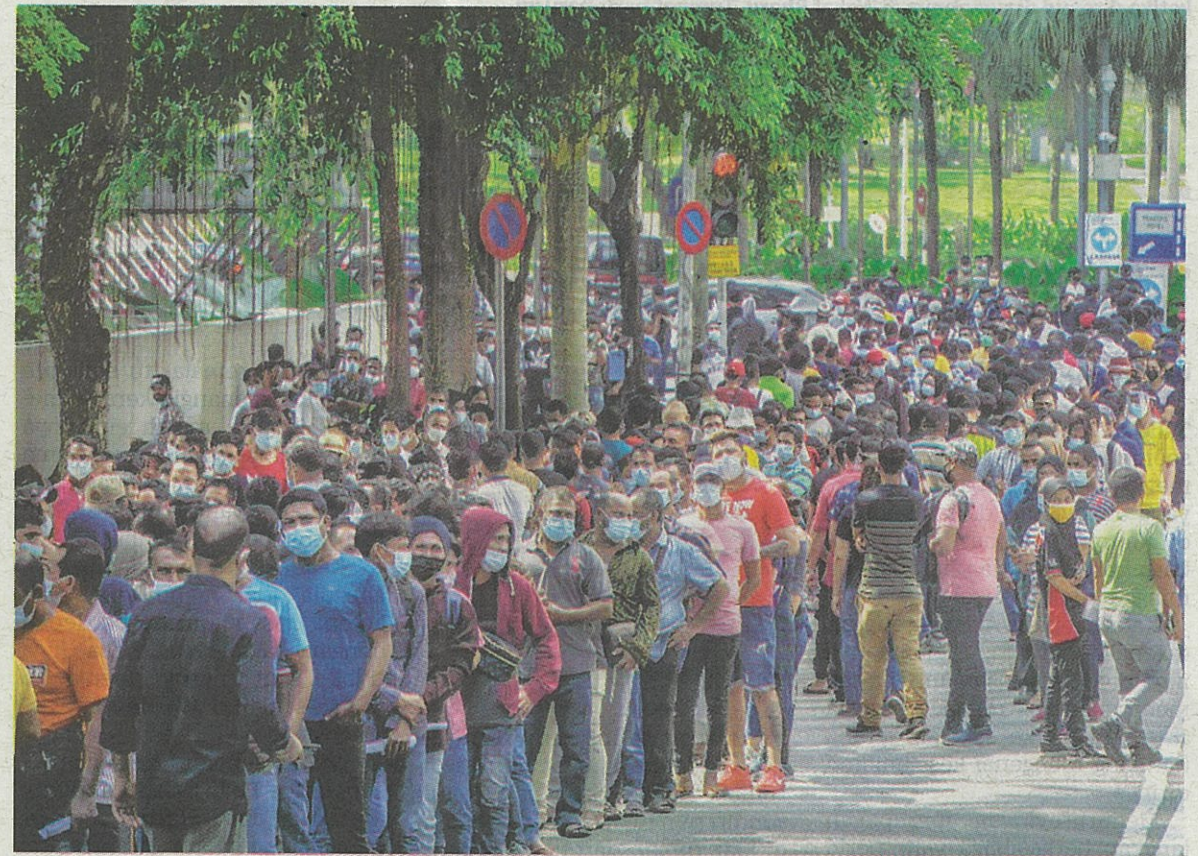
MALAYSIA tetap akan mengambil pekerja dari Kemboja walaupun terdapat rakyat negara ini yang menjadi mangsa penipuan pekerjaan di negara itu. – GAMBAR HIASAN

“Kita dah buka untuk 14 negara, tolonglah cuba dapatkan pekerja-pekerja asing dari semua negarasokongan. Apabila kita bergantung kepada dua negara sahaja (Bangladesh dan Indonesia), terlalu banyak syarat,” katanya.