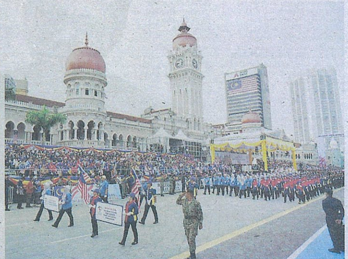
PERBARISAN Kontinjen KSM di Dataran Merdeka.