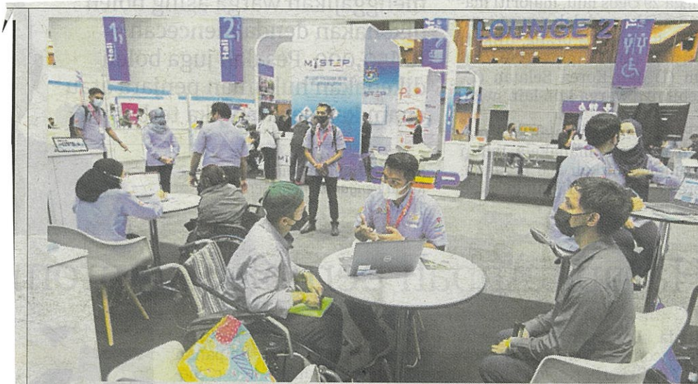
Karnival kerjaya platform terbaik golongan belia dapatkan pekerjaan.