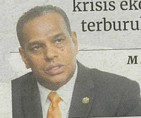
M Saravanan, Menteri Sumber Manusia

“Kerajaan Sri Lanka sudah mengemukakan permohonan rasmi untuk membekalkan tenaga kerja dan memohon kuota sebanyak 10,000 pekerja. Ini antara usaha kerajaan untuk membantu Sri Lanka yang sedang berdepan krisis ekonomi terburuk”