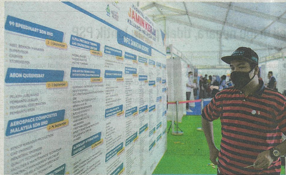
Karnival Kerjaya Jamin Kerja sempena program Jelajah Aspirasi Keluarga Malaysia memberi peluang kepada rakyat untuk mencari peluang pekerjaan sekali gus mengurangkan kadar pengangguran di negara ini.