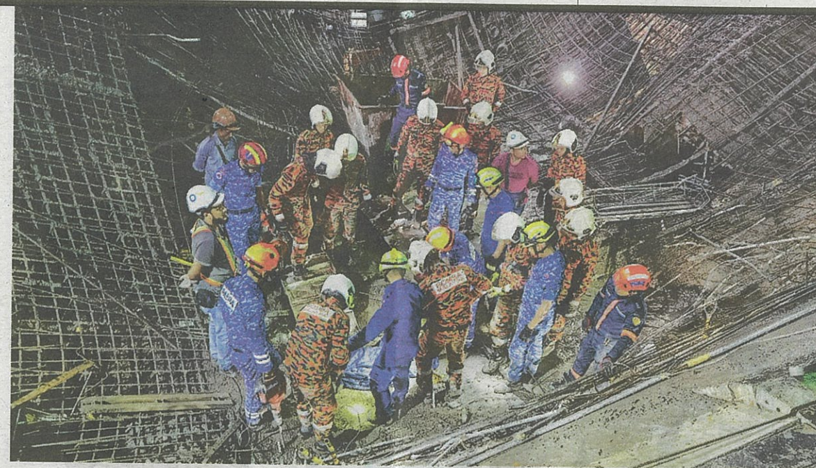
ANGGOTA bomba menjalankan operasi mencari dan menyelamatkan mangsa yang tertimbus di bawah runtuh bangunan di Oxley Tower, Jalan Ampang, Kuala Lumpur, semalam.

Lelaki warga Bangladesh berjaya dikeluarkan bomba selepas tujuh jam operasi