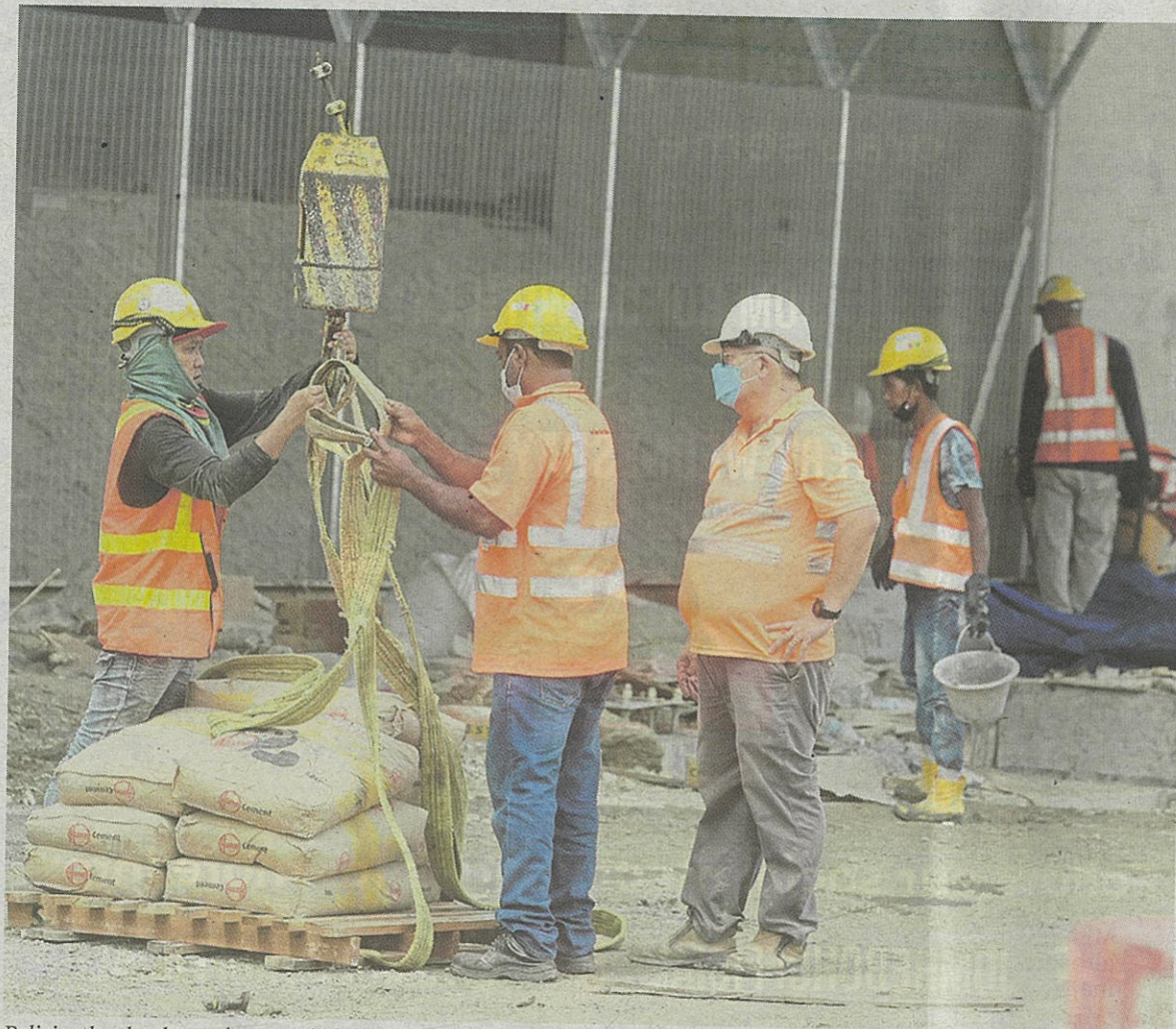
Policies that lead to an increase in labour costs can affect the employment rate and economic recovery. FILE PIC

If employers do not have the financial capacity to absorb the over-