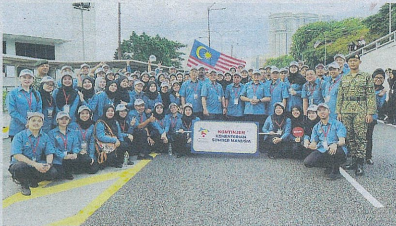
KONTINJEN Kementerian Sumber Manusia semasa Hari Kebangsaan Malaysia ke-65.

raptai, mereka melatih kakitangan KSM berkawad dengan penuh keikhlasan dan kesabaran.