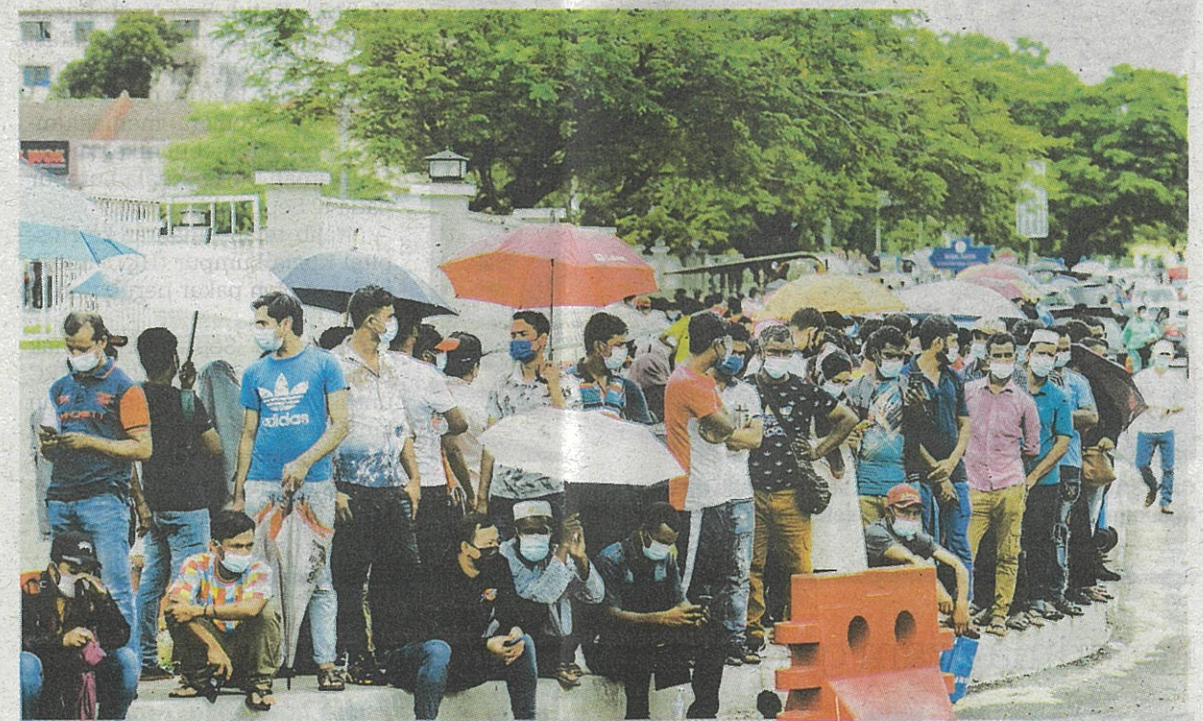
MALAYSIA membantu Sri Lanka dengan mengambil 10,000 pekerja dari negara itu yang ketika ini berdepan krisis ekonomi terburuk. – GAMBAR HIASAN

“Bagi mana-mana majikan yang berminat, mereka boleh terus menghubungi Bahagian Pengurusan Pekerja Migran KSM ( oscksm@mohr.gov.my ) atau Jabatan Tenaga Kerja Semenanjung Malaysia ( jtksm@mohr.gov.my ) untuk maklumat lanjut,” tambahnya.